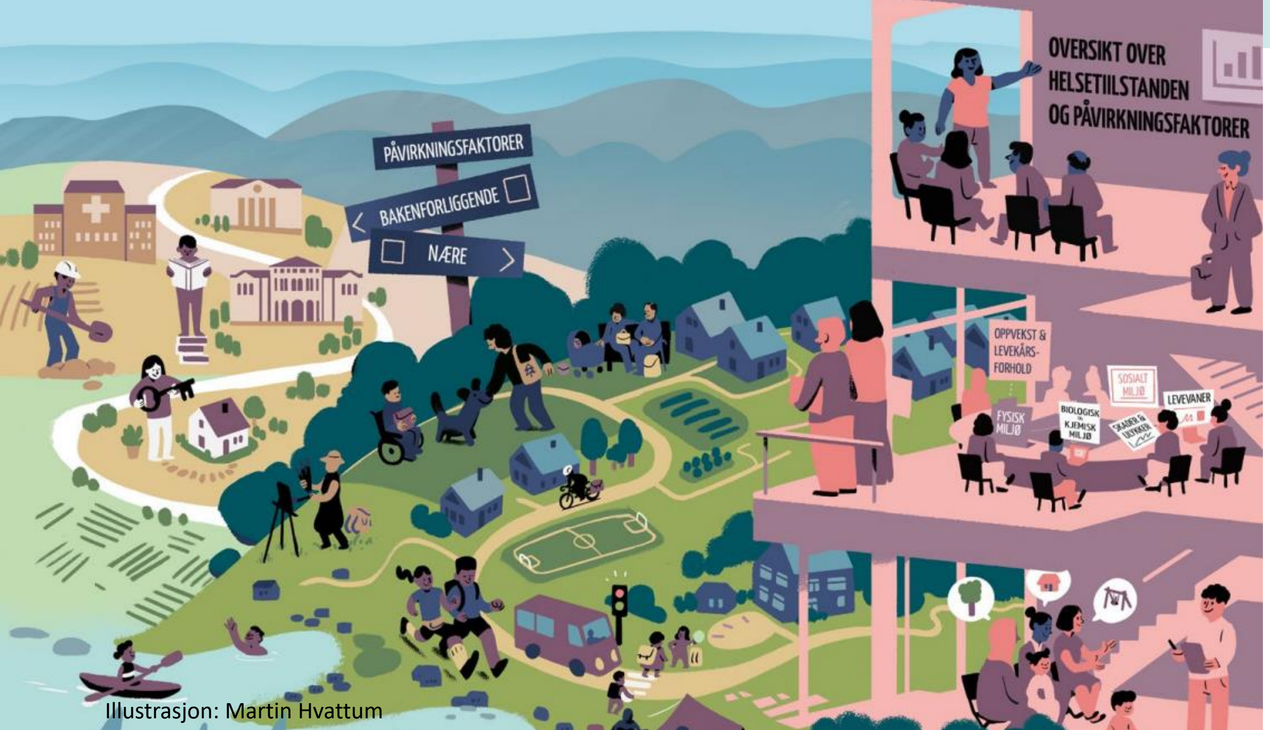
Illustrasjon: Martin Hvattum