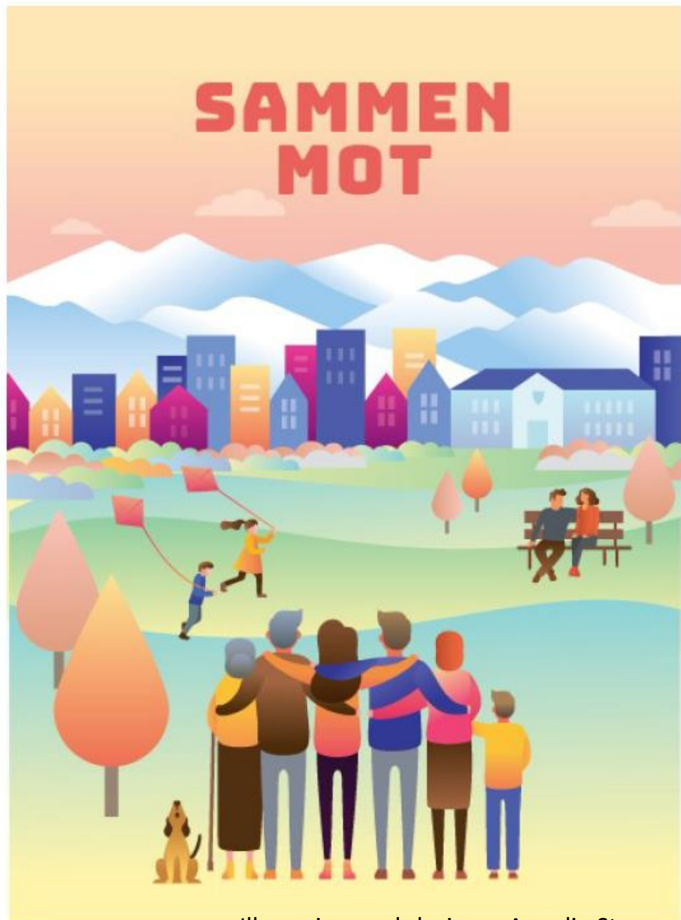
Illusrasjon: webdesigner Annelie Stenman