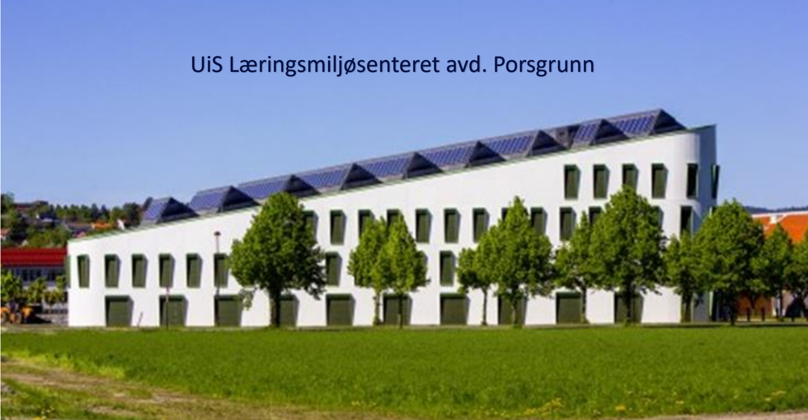
UiS Læringsmiljøsentret avd. Porsgrunn