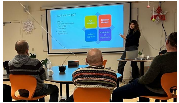
Bilde 1 – Opplæringsøkt i Danmark

Samskapte opplæringsøkter og langsiktig faglig utvikling (engelsk: Continuous Professional Development – CPD) for lærere, pedagoger og universitetsforskere øker engasjementet og gir en mer meningsfull utdanning. Denne samarbeidsmetoden bygger sterke forbindelser og fremmer gjensidig læring blant alle deltakerne. Gjennom denne prosessen får “eksperter” innsikt i reelle utfordringer og praktiske løsninger, mens lokale undervisere utvikler en dypere forståelse av sine egne praksiser.