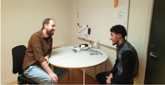
Bilde 5 – Personlige samtaler i Danmark.

Å oppmuntre til uformelle samtaler på skoler bygger gjensidig tillit og forståelse og fremmer åpen dialog og aktiv lytting mellom ansatte og barn og unge. Disse interaksjonene gir individuell støtte og gjør det mulig for lærere å følge de unges utvikling på nært hold. Disse samtalene er svært effektive for etablering av likeverdige relasjoner.