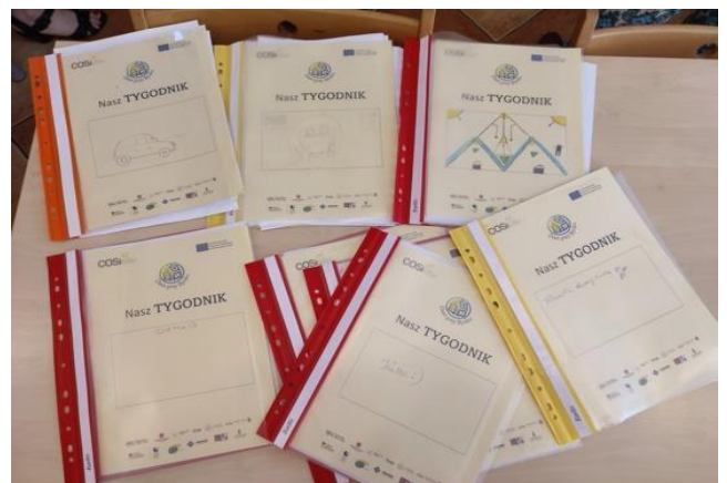
Bilde 3 – Samskapt dagbok i Polen.

I Polen samarbeidet ansatte og unge om å samskape en dagbok som skulle dokumentere individuelle mål, strategier og framgang gjennom skoleåret. Samskrivingen skjedde i personlige møter. Denne samarbeidsformen fremmer en balansert tilnærming til å håndtere forventninger og samordne utdanningsperspektiver og mål.