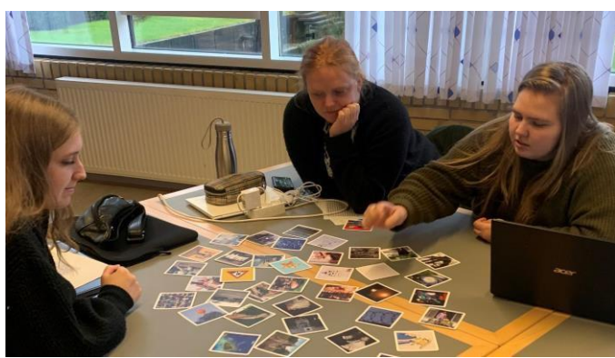
Bilde 6 – Photovoice og kollasjølser i Norge.