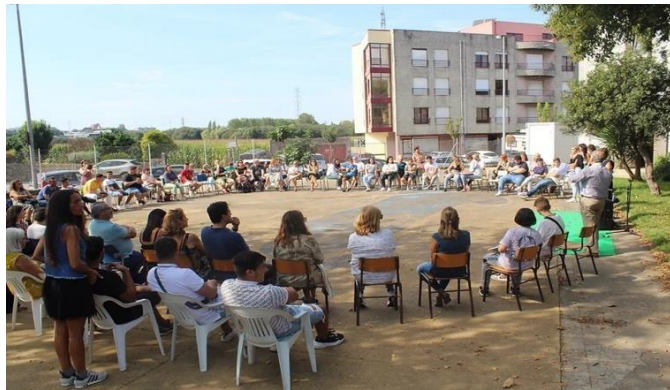
Bilde 2 – Samskapende forsamling på E2OM i Portugal.