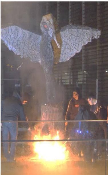
Bilde 9 – «Judas-brenning» med unge på E2OM i Portugal.