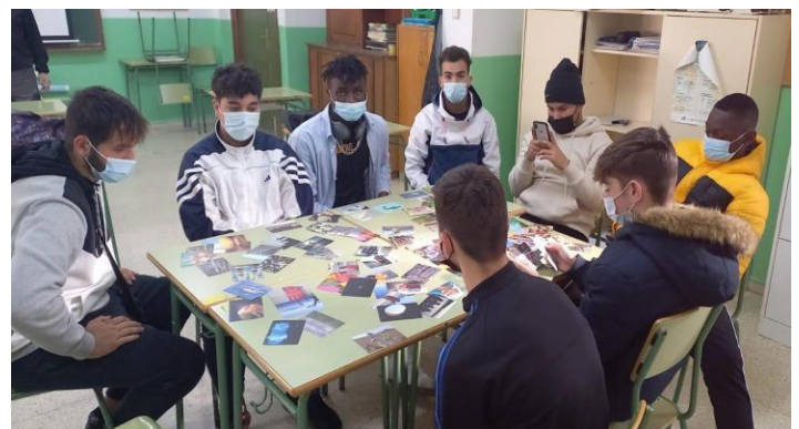
Bilde 10 – Sikhona-kortmetoden på Palma de Mallorca i Spania.

Dette er en metode for å lette læringsprosessen ved å forbedre mellommenneskelig kommunikasjon og etablere relasjonelle bånd. Metoden ble implementert på Palma de Mallorca i Spania, der fagpersoner bruker dette med unge innvandrere. Gjennom bilder og direkte/indirekte spørsmål følte de unge at de kunne uttrykke sine følelser og snakke om sine opplevelser. Denne praksisen gjør at unge føler seg mer komfortable med å dele sine historier, fordi de befinner seg i et tillitsfullt miljø. Delingen gjør det mulig for fagpersoner å forbedre sin pedagogiske praksis.