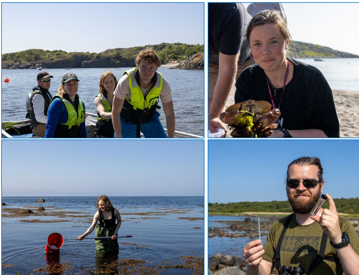
Feltkurs i faunistikk i Stavern.

Du har et variert år foran deg og vil få delta på flere spennende feltkurs hos oss. Se smakebiter fra et av vårens feltkurs i bildene under.